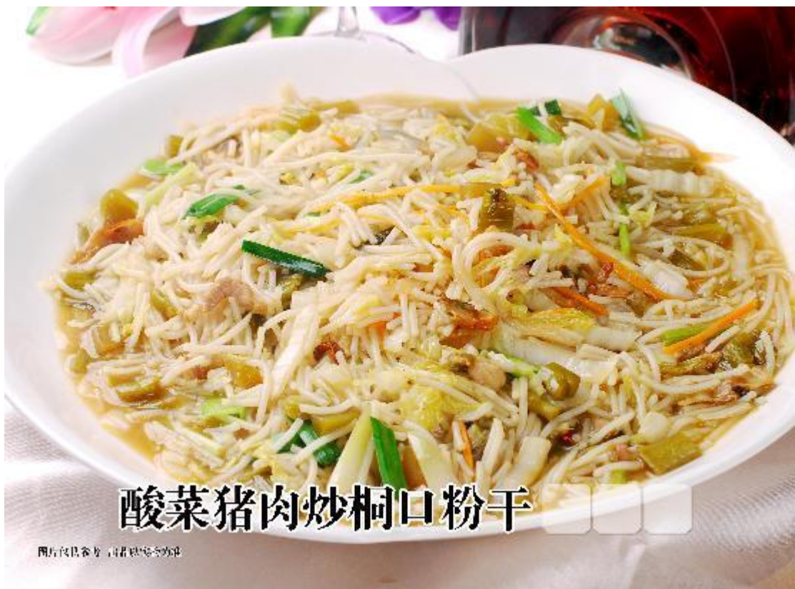
酸菜猪肉炒桐口粉干