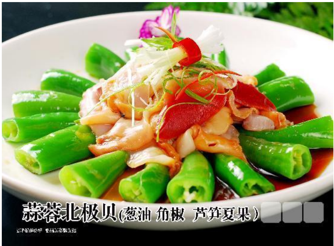
蒜蓉北极贝(葱油 角椒 芦笋夏果)