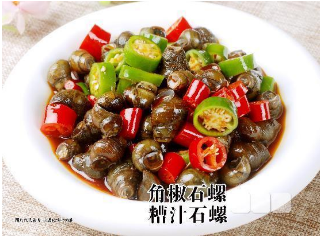
角椒石螺 糟汁石螺