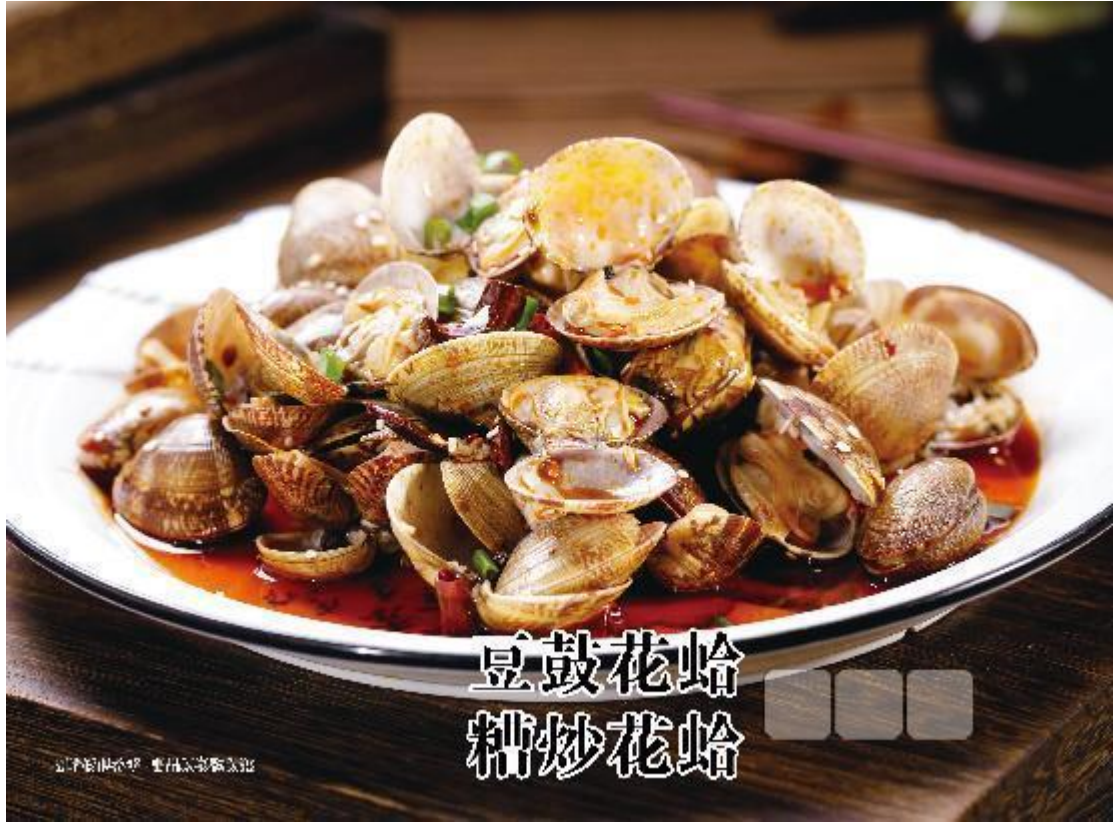
豆鼓花蛤 糟炒花蛤