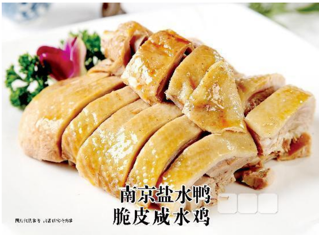
南京盐水鸭 脆皮咸水鸡