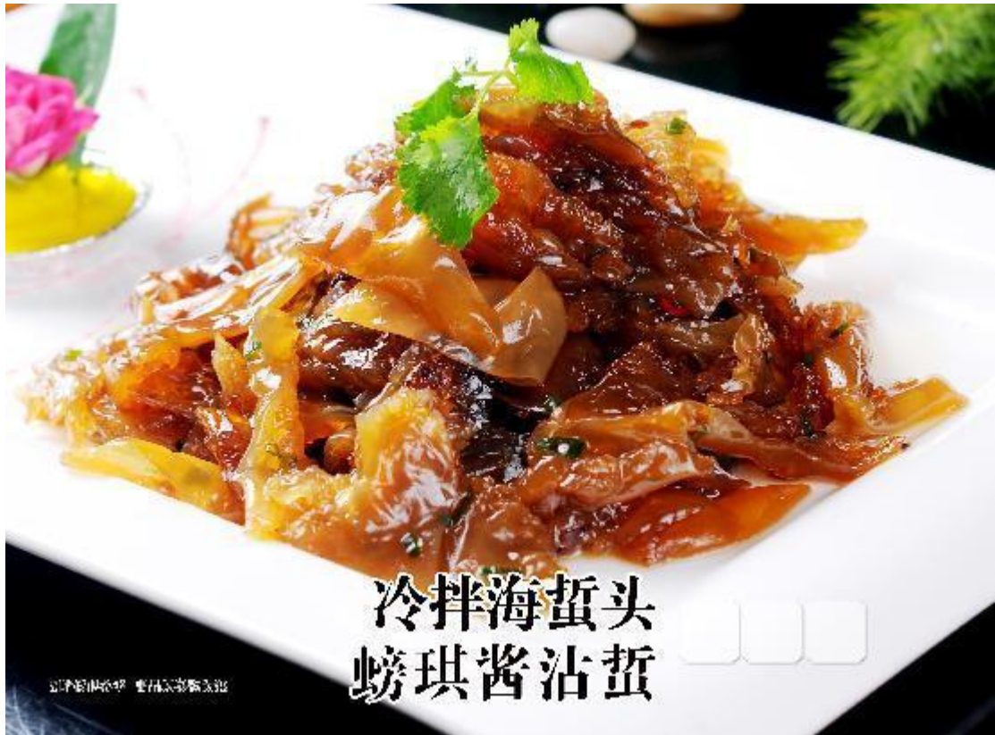
冷拌海蜇头 蛰琪酱沾蜇